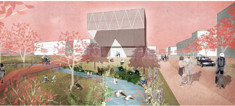
Ideenwerkstatt Neuer Stadtraum Bantlinstraße, Reutlingen/asp Architekten, Stuttgart; Markus Weismann spricht im Seminar REFLEXIONEN: Neue Leitbilder, 16.00 Uhr und im Plenum FAZIT: Gestaltungsaufgabe Zukunft, 17.45 Uhr